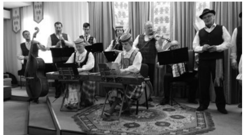
Koncertuoja Alytaus ansamblis „Dainava“.