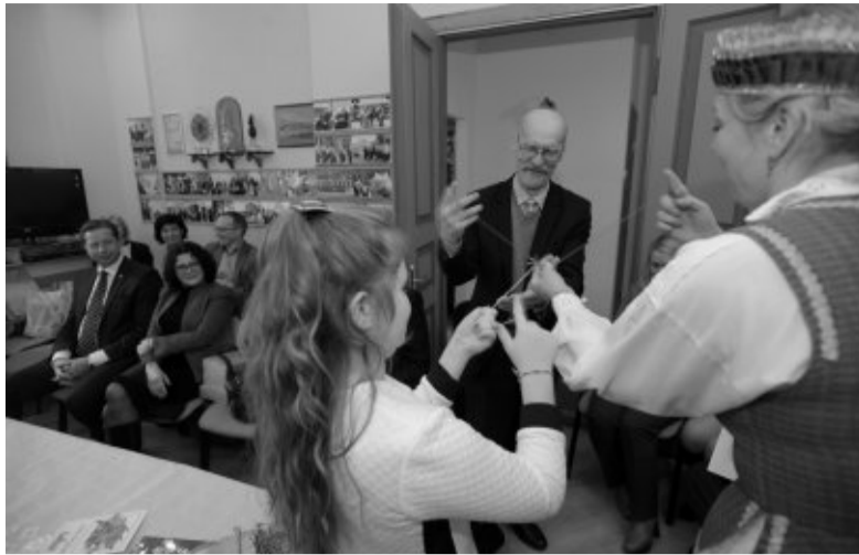
Teksto autorius Gardino lietuvių moksleivių tarpe.

Universiteto vadovybė pageidautų gauti metodinės ir akademinės paramos iš Lietuvos aukštųjų mokyklų, taip pat pageidautų turėti galimybę Gardino universiteto studentams dalyvauti intensyviuose kursuose Lietuvoje. Rektorius manymu, universitetas galėtų lietuvių kalbos mokymui ir studijoms toliau teikti tas pačias materialines ir technines sąlygas kaip ir iki šiol. Susitikimo metu buvo įvardyta galimybė parengti programą anglų kalbos specialybės studentams studijuoti lietuvių kalbą kaip antrąją užsienio kalbą.