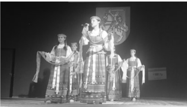
Scenoje – meninės kompozicijos „Lietuvos istorijos kryžkelėse“ atlikėjai Šalčininkų Lietuvos tūkstantmečio gimnazijoje.

Pelesos vidurinės mokyklos lietuvių mokamąja kalba mokytojas