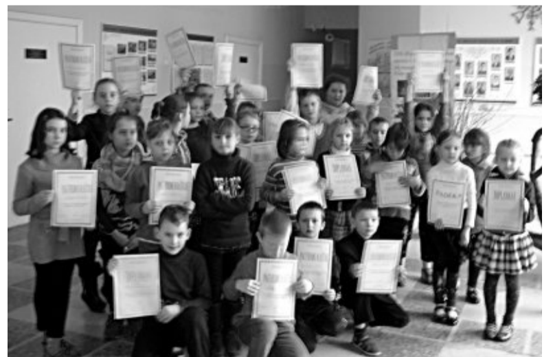
Minime Knygnešio dieną.