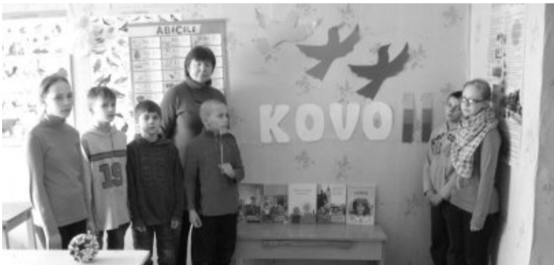
Mažesniųjų grupės vaikai.