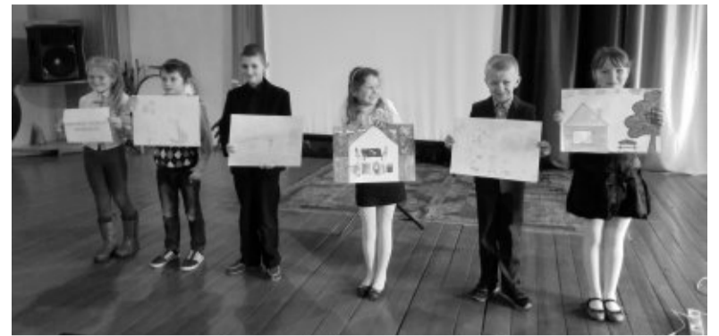
Iliustracijos pamėgtoms baltarusių liaudies pasakoms.